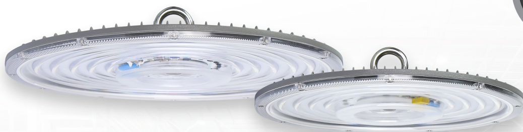
PNB NLO 02 150w