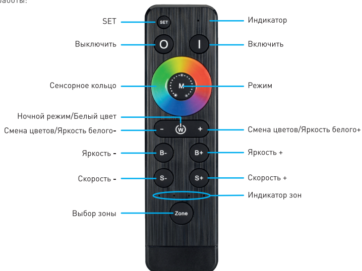
Рисунок 1. Назначение кнопок пульта управления ARL-STICK-DIM