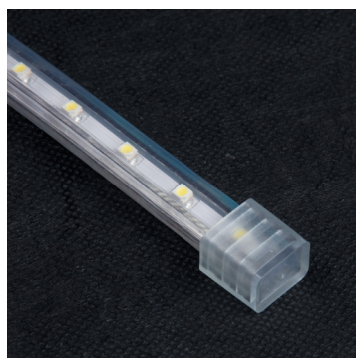
Торцевая заглушка для изоляции конца ленты MVS