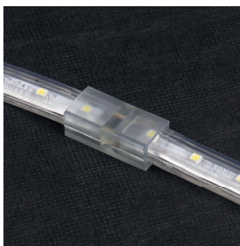
Коннектор для соединения отдельных участков ленты MVS