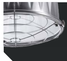
Светильники могут комплектоваться защитной решеткой. Код заказа защитной решетки – 2311000120