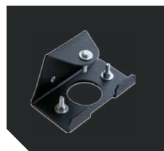
Кронштейн для крепления НВ на трос, профиль, трубу (код заказа - 2311000220)