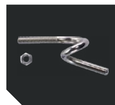
Комплект крепления на трос НВ с витым крюком (код заказа - 2311000150)